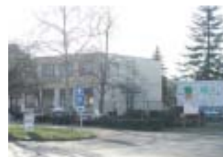
A vállalkozó város

Támogatnunk kell olyan új vállalkozások létesítését melyek perspektivikus, ám a helyi palettáról még hiányzó tevékenységi területeken jönnek létre. Folytatni, illetve kibővíteni kell a meglévő inkubációs kezdeményezést. A vállalkozások helyi-térségi klasztereinek létrehozásában aktív szerepet kell felvállalnunk, különösen az első informálódási, egyeztetési szakaszban. Segítséget tudunk nyújtani a klaszterek létrehozását indokló háttér tanulmányok kidolgozásában, elsősorban külső szakértők bevonásán keresztül. Ösztönözhetjük helyi vállalkozások közötti stratégiai szövetségek létrehozását, segíthetjük térségi franchise rendszerek terjedését.